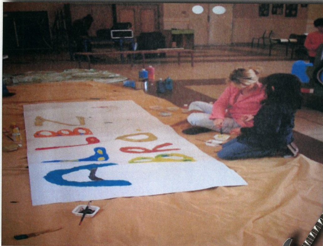
LA BANDEROLE EN PLEINE PRÉPARATION :-)