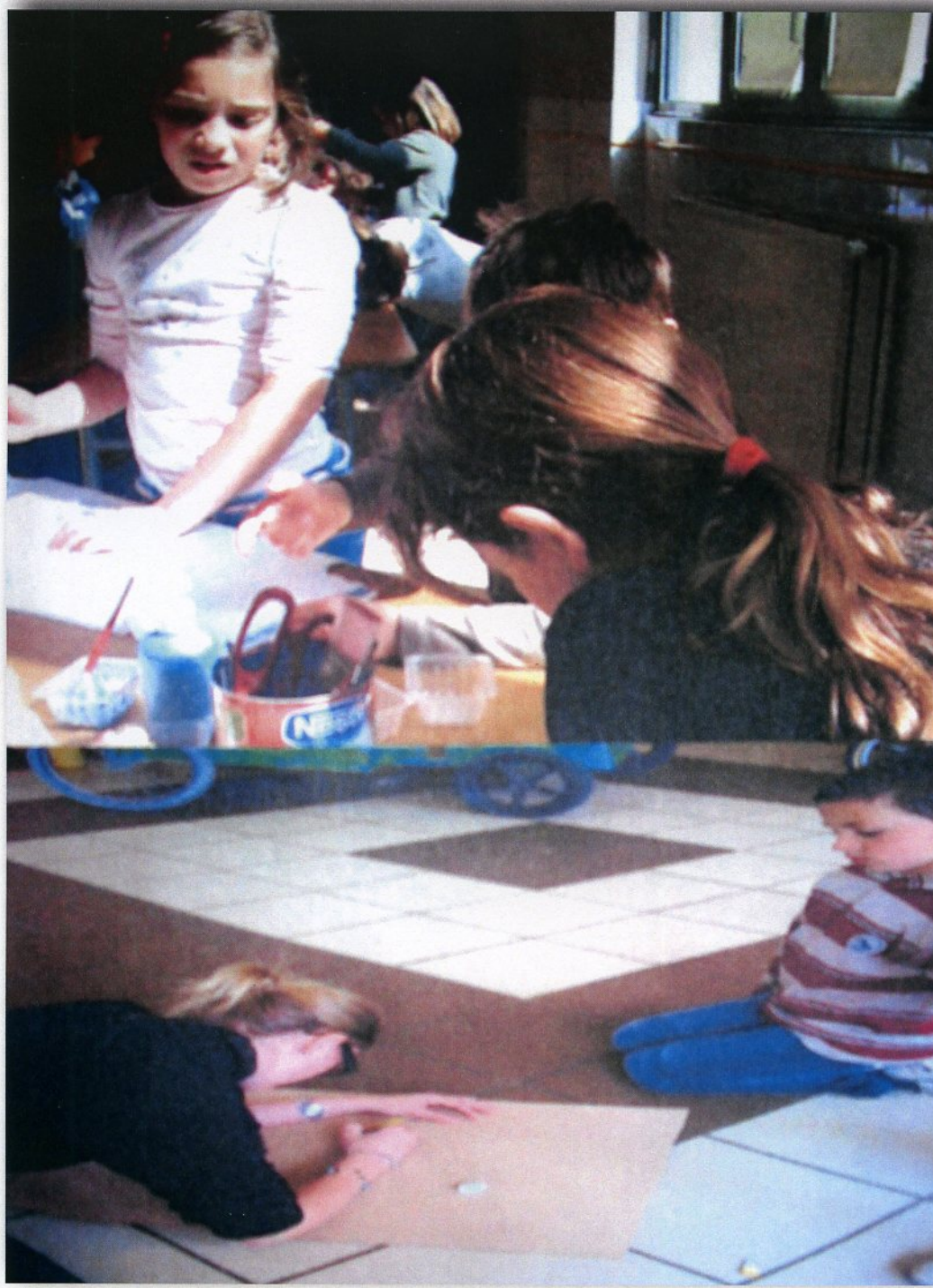
LES ANIMATEURS SONT DE LA PARTIE :-)