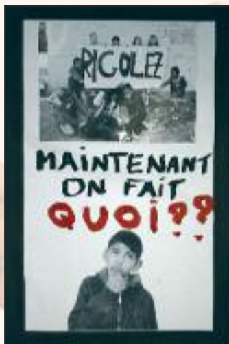
Centre de loisirs primaire Anatole France (La Courneuve) Lauréat "Agis pour tes droits" 2006