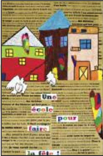
Ecole publique de Bieuzy-les-eaux Lauréat "Agis pour tes droits" 2005

Comme chaque année dans ma classe, on travaille sur les droits des enfants dans l'école et dans la classe. Les mots des enfants ne sont jamais les mêmes et il n'y a guère de routine dans ce travail. C'est ainsi que les droits et les devoirs des enfants s'affichent, un autre travail commence, celui qui fera que ces mots, écrits ensemble, prendront vie concrètement. Vivre ses droits au quotidien, ce n'est pas simple, il faut apprendre ensemble.