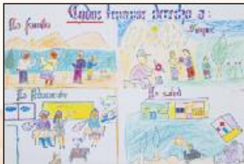
Maison de l'Enfance Unidad Educativa Mahamota (Potosi - Bolivie) Lauréate "Agis pour tes droits" 2007