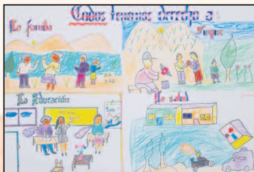
Maison de l'Enfance Unidad Educativa Mahamota (Potosi - Bolivie) Lauréate "Agis pour tes droits" 2007