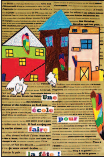
Ecole publique de Bieuvy-les-eaux Lauréat "Agis pour tes droits" 2005

Comme chaque année dans ma classe, on travaille sur les droits des enfants dans l'école et dans la classe. Les mots des enfants ne sont jamais les mêmes et il n'y a guère de routine dans ce travail. C'est ainsi que les droits et les devoirs des enfants s'affichent, un autre travail commence, celui qui fera que ces mots, écrits ensemble, prendront vie concrètement. Vivre ses droits au quotidien, ce n'est pas simple, il faut apprendre ensemble.