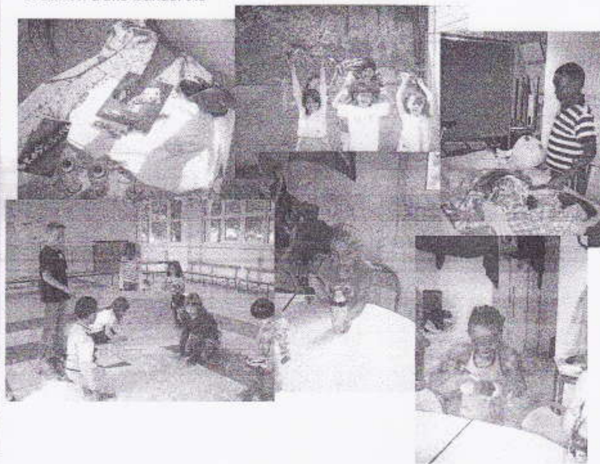
Le centre de loisirs Brossolette Des Pavillons sous/Bois. Le 18 juin 2008.