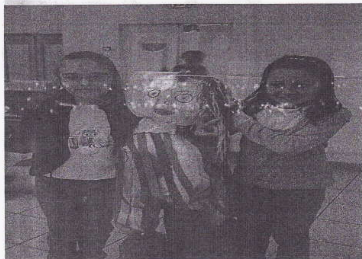
La super mascotte!