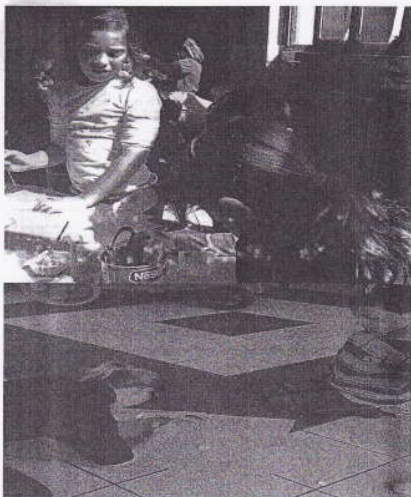
Les animateurs sont de la partie! :)