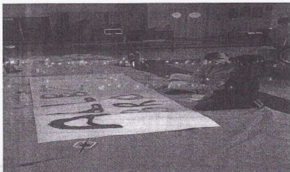
La banderole en pleine préparation :)